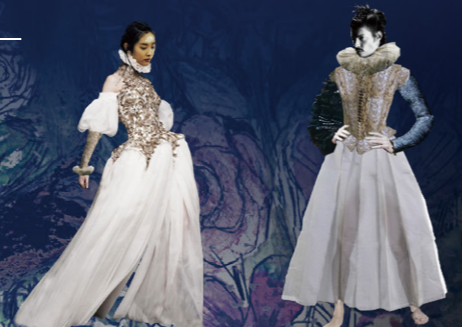
エリザベス調と和の要素をミックスした妖精の衣裳

シェイクスピアの名作「夏の夜の夢」が ファンタジックなオペラになった! 夢の世界へお連れするのは、我らがマエストロ佐渡裕。 今宵、音の魔法が降り注ぐ!