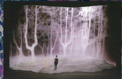
霧の立ち込める森をイメージした舞台装置