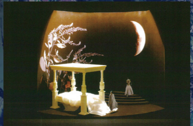
花の咲き乱れるティターニアの寝床