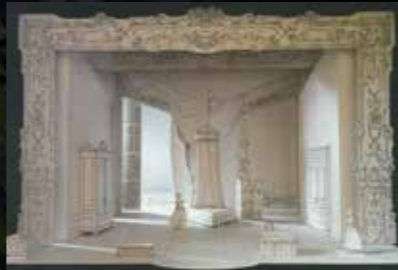
2幕 舞台模型 伯爵夫人の部屋

「絡み合う人間関係、収まらないベクトル。それが“フィガロ”の面白さ」と語る佐渡裕。この夏、マエストロがプロデュースする魅惑の“フィガロ”。最高の舞台を用意して、劇場でお待ちしております!