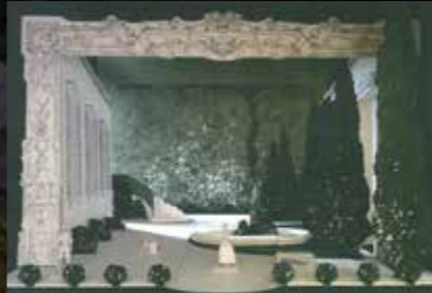
4幕 舞台模型 夜の中庭

set & costume design by Robert Perdziola